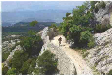
Op 950 meter hoogte met uitzicht op de Mont Ventoux

Met maximale inzet en de nodige risico's volg ik waar mogelijk het voorbeeld van de superspecialist. In een paar uur leer ik voor maanden bij. De steilste afdaling denk ik te redden, totdat ik vol in de struiken crash. Savoir vivre is een Frans levensmotto dat vrij vertaald 'geniet van het leven' betekent. Voor mij is het vandaag een savoir survivre , de kunst te overleven. Met een 'pas mal', stuurt Taillefer me een paar stunts later met enige hoop terug naar Nederland. 🇳🇱