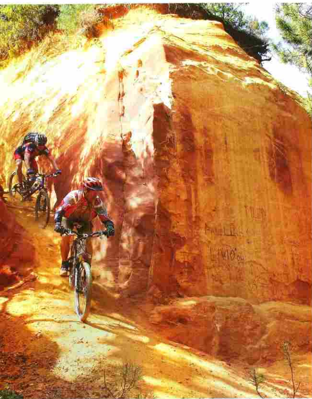
Naar La Croix de Christol vanuit Rustréil langs goudgeel gekleurde voormalige steengroeven

wandelmarkeringen binnendoor naar parkeerplaats Mistral te volgen. Daar waarschuwt de zon dat het einde van de tocht nader. Via een tweesporenpad dalen we af, om via de verharde weg terug te keren.