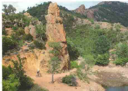
Ecureuil, een verscholen meertje met uitgesleten rotspunten